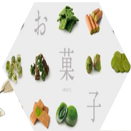
祇園辻利 (祇園總店)