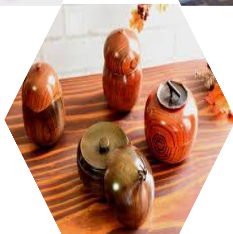
京都漆器、茶筒 (手工漆器)